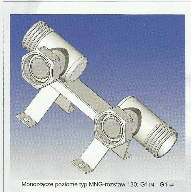
Monozłącze poziome typ MNG-rozstaw 130; G11/4 - G11/4